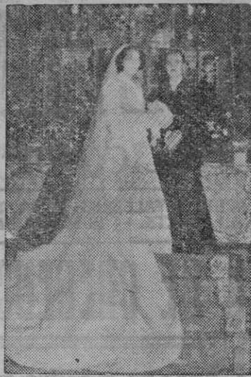
Boda Garau-Guasch, celebrada anteayer en la iglesia de San Felipe Neri