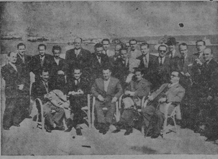
Un grupo de periodistas barceloneses estuvo ayer en nuestra ciudad. Y, en la terraza del Hotel Mediterráneo, acompañados de sus colegas palmesanos, fué lograda esta foto, a primera hora de la tarde