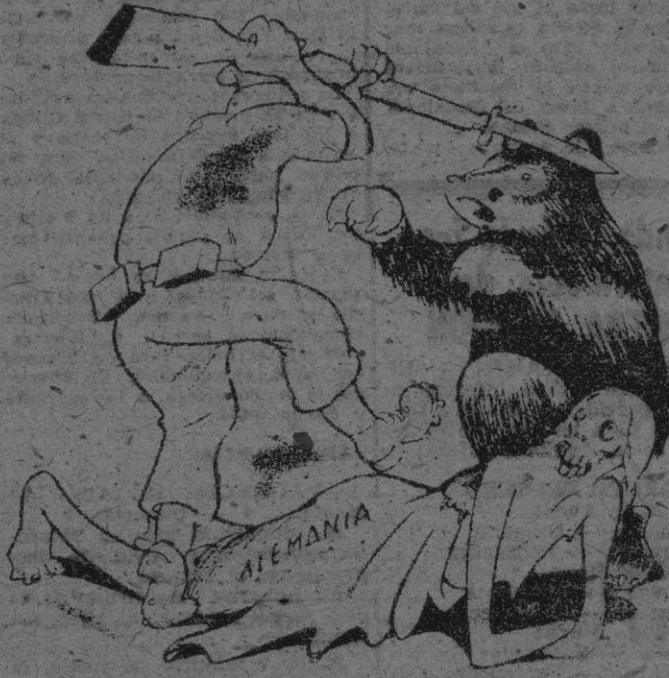
—DÍGAN, ¿NO PODRIAN IR A PELEARSE A OTRO SITIO?

VARIOS PARA ANUNCIOS en esta sección, en CORREO DE MALLORCA calle Mora, núm. 3 y Publicidad SUAU, Mar. 9 Teléfono 3914