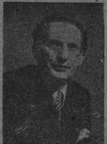
ALCIDES DE GASPERI

MILAN, 19 (Servicio especial Efe - Reuter). — La Plaza del Duomo está abarrotada de público que espera los resultados de las elecciones. La policía patrulla fuertemente armada por la ciudad. Los miembros de la "Agit" (propaganda comunista) se dirigen a las masas, que muestran más interés por los carteles luminosos del "Corriere della Sera", donde van apareciendo los resultados. La impresión general entre el público es de alivio al conocerse la derrota comunista.