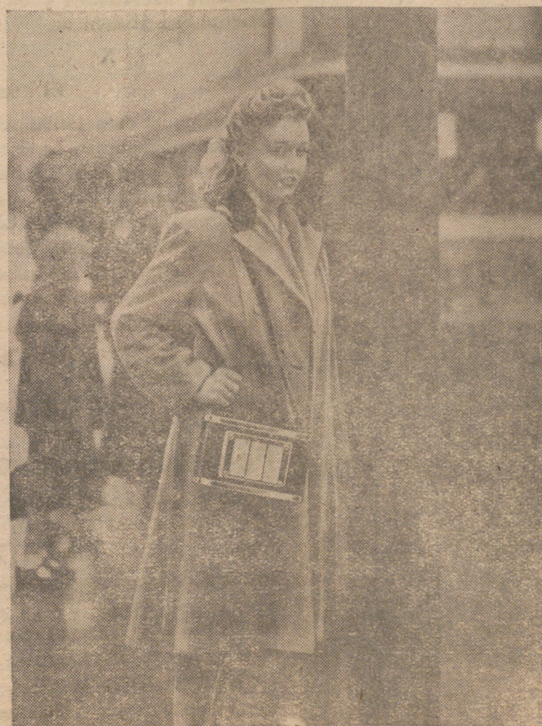
En la exposición que se celebra actualmente en Londres bajo el título «La Gran Bretaña puede hacerlo», figura este nuevo tipo de radio portable que aparece en la fotografía como si fuese la última novedad en bolsos para señoras.