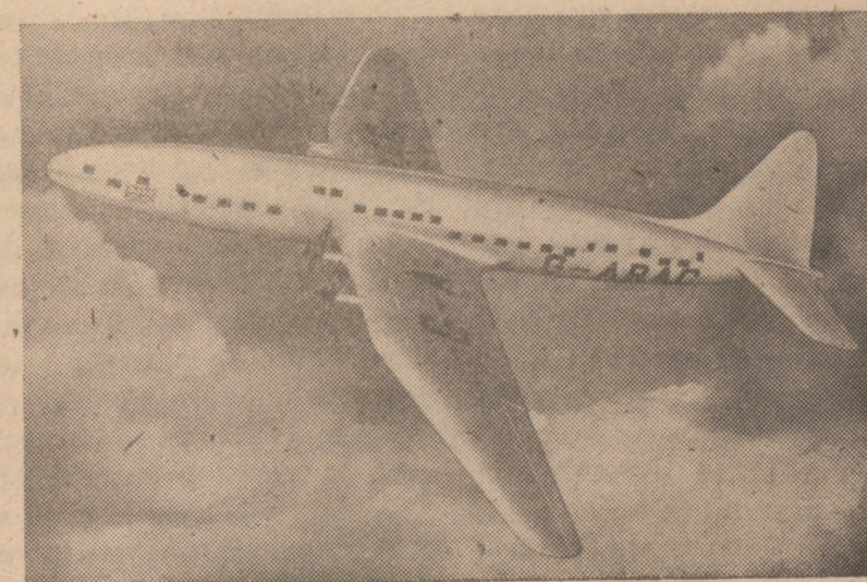
Fotografía de un modelo de avión tipo «Bristol Brabazon». Entrará en servicio el próximo año entre las rutas transatlánticas.