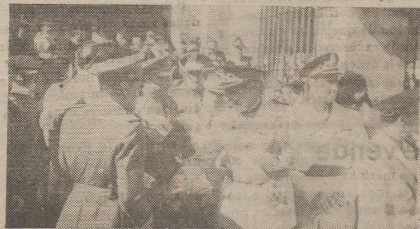
La fiesta del Caudillo se verificó brillantemente en toda España y en Madrid se celebró un solemne Te Deum en la Basílica de San Francisco el Grande al que asistieron diversas representaciones diplomáticas y todas las autoridades nacionales.

«El Gobierno del Estado español y el Gobierno de la República de Colombia, animados por el deseo de desenvolver su intercambio comercial y recíproco y facilitar las relaciones entre ambos países, de acuerdo con lo dispuesto en el artículo octavo del acuerdo comercial y de pagos firmado entre ambos países en 1943, han procedido por un muy reciente canje de notas a la prórroga de mismo por un año.»