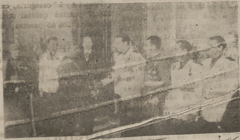
Con motivo de la fiesta del Caudillo S. E., el Jefe del Estado recibió a las primeras autoridades nacionales, al Cuerpo Diplomático y otras personalidades en brillante recepción que se verificó en el Palacio de El Pardo.

TIEMPO PROBABLE.—Aumento general de la nubosidad, especialmente en la parte noreste de la Península, donde es probable que se produzcan algunas tormentas poco intensas. Disminución de la temperatura, principalmente en las regiones del noreste.