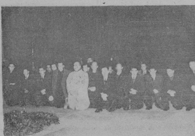
Madrid. — Los mineros asturianos que llegaron a Madrid para agradecer al Caudillo las mejoras sociales de que han sido objeto, visitan la tumba de José Antonio en el Escorial, en la que depositan una corona de flores.

Visita de delegados de la Oficina internacional de Trabajo a Jorge VI Londres. — 12 delegados de la Oficina Internacional de Trabajo fueron ayer recibidos por el Rey Jorge VI en el palacio de Buckingham. Entre los visitantes figuraba el delegado de España. EFE