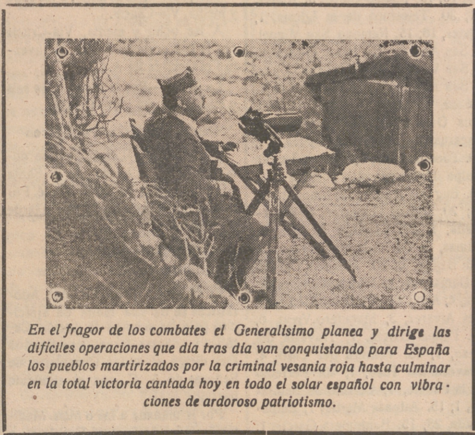
En el fragor de los combates el Generalísimo planea y dirige las difíciles operaciones que día tras día van conquistando para España los pueblos martirizados por la criminal vesania roja hasta culminar en la total victoria cantada hoy en todo el solar español con vibra- ciones de ardoroso patriotismo.

Terminada la Santa Misa, pasaron a la tribuna las primeras autoridades reseñadas y comenzó el brillantísimo (Continúa en 4.ª página)