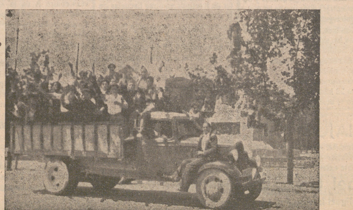
En el día de la victoria, los hijos de España, libres de la tiranía roja, exte- riorizan su alegría, aplaudiendo a los soldados victoriosos de Franco.