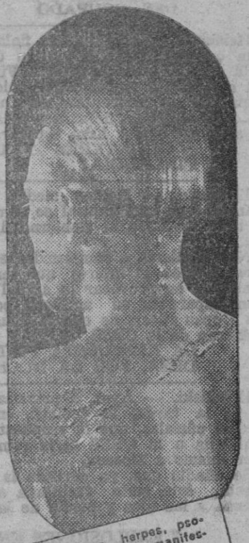
El aczema, herpes, psoriasis, etc., son manifestaciones de una sangre viciada que se debe purificar con el DEPURATIVO RICHELET

El Depurativo Richelet, es más que nada "rectificador" por excelencia de la sangre viciada, ya que bajo su acción la masa sanguínea se purifica completamente. La sangre vuelve a