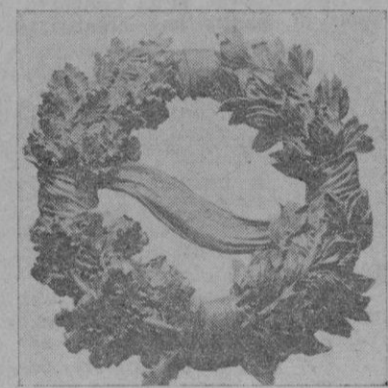
La corona de bronce regalada por el Duca para la tumba de José Antonio

Madrid. — El cortejo que lleva, Alicante a El Escorial, los restos de José Antonio, llegó al pueblo Villatobos (Prov. de Toledo), a ocho menos cuarto. Todo el pueblo le esperaba, fantásticamente iluminado a la luz de las hogueras. Allí se celebró el relevo: los falangetas de León cedieron las andas a los de Palencia. Estos llevaron el féretro hasta las doce y media de la noche. De Palencia estaban, además de las