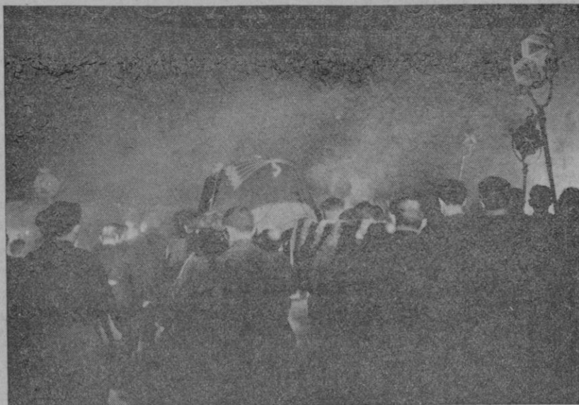
Impresionante caminar del cortejo fúnebre de José Antonio huminado por las lumbradas de las hogueras y los hachones.

Madrid. — Hoy, martes, la representación de Baleares se hará cargo de los restos de José Antonio, a las 5 de la tarde.