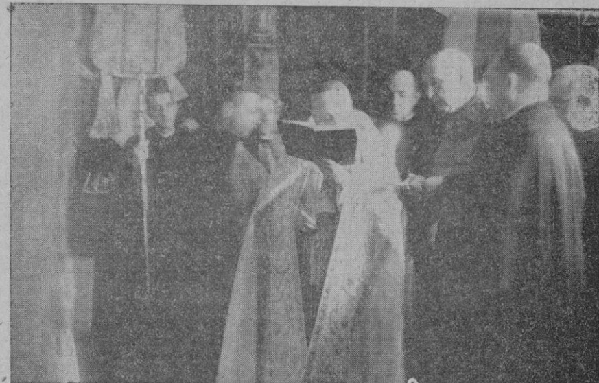
El Excmo. y Rdmo. Sr. Arzobispo-Obispo de Mallorca bendiciendo la exposición de ornamentos sagrados para las iglesias devastadas por los rojos, instalada en el oratorio de San Pedro y San Bernardo.

Respecto a pretendidos trabajos de fortificación, hechos apresuradamente en la frontera hispano-francesa y dirigidos por técnicos alemanes e italianos, la España Nacional los desmiente rotundamente y ofrece libre acceso a sus fronteras a los corresponsales de prensa extranjeros y a las personalidades de Europa, para que puedan comprobar la falsedad de tal especie.