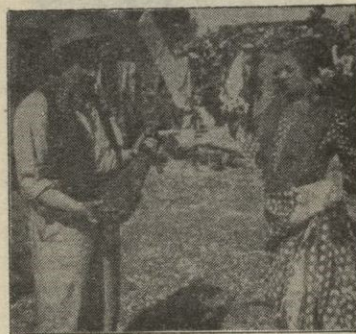
Lola Flores. «La morena clara» en una escena del film.

Después de un muy particular paseo por la historia de la raza calé, se llega a los años en que en una cueva la gitana Trinidad Vargas vende sus conjuros a la gente, entre la que se encuentra, ¡qué mala suerte!, el temible corregidor de la villa, don Lope de Baena, que hace prender a Trinidad.