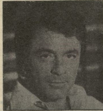
Bill Bixby, gracias a esta serie, ha saltado nuevamente a la popularidad internacional.