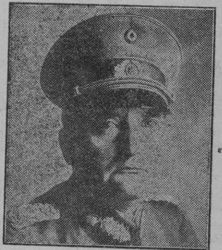
Berlín. — El general Kurt, barón von Hammerstein Equor, que tomará el mando del ejército alemán en sustitución del general Heyes, que será jubilado el 1.º de Diciembre próximo.