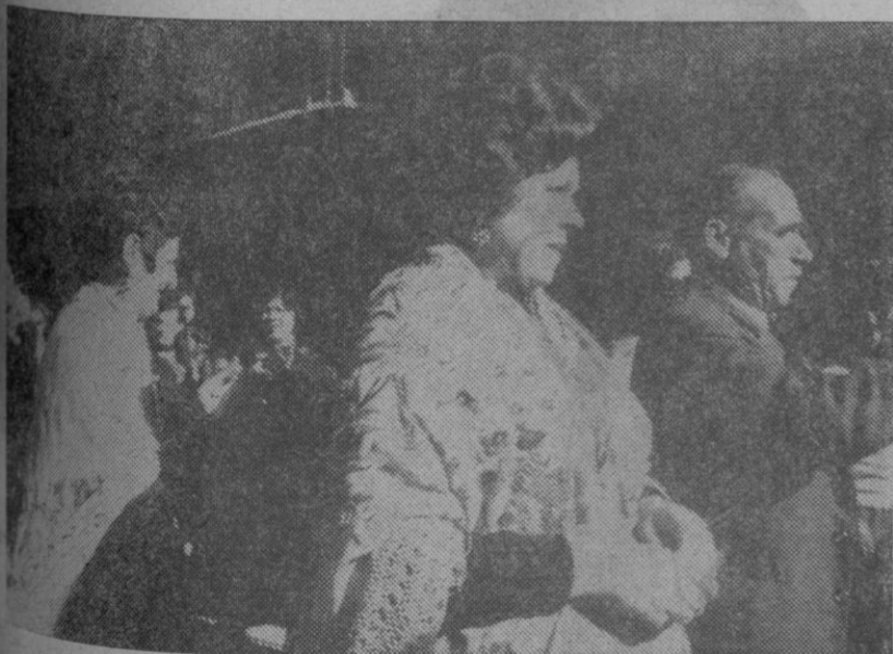
Zamarriegas vestidas con el traje típico, junto al dulzainero