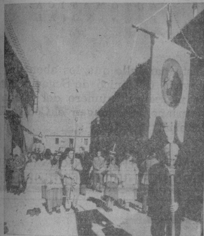
La procesión, por las calles del barrio