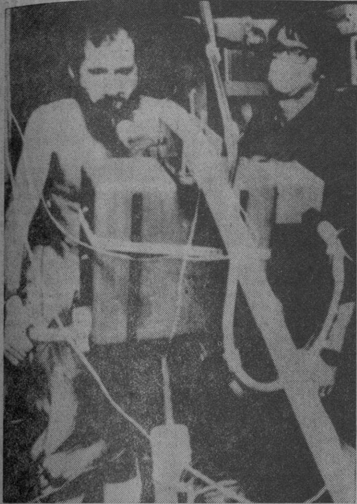
Uno de los astronautas durante el reconocimiento médico

Houston, 11.—Los tres astronautas del «Skylab» que han concluido recientemente su misión espacial de 85 días, llegaron anoche a sus domicilios, siéndoles tributada una cariñosa acogida por sus esposas y un grupo de unas quinientas personas. Efe-Reuters.