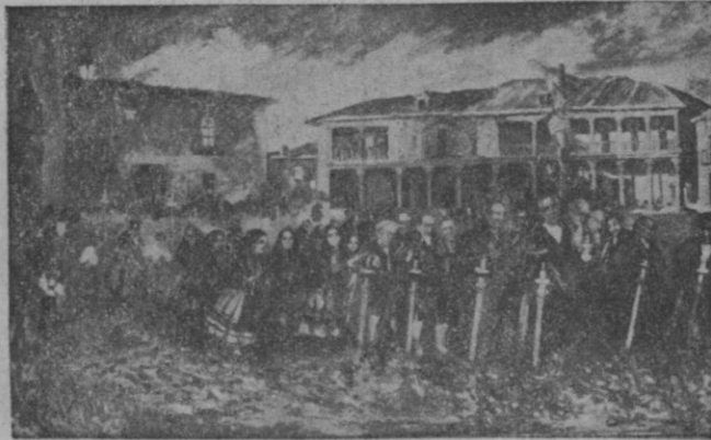
Via Crucis en Pedraza, óleo de Tablada

Toros en Pedraza, en Turégano, en Segovia, en su querida Sepúlveda...; romerías, que son otro motivo del tradicional fervor del pueblo rural y que llevan aparejado el íntimo folklore. Estos cuadros, esos motivos rurales, esos lienzos urbanos y esta Segovia cuyos rincones más sugerentes ya conocen la presencia de este ar-