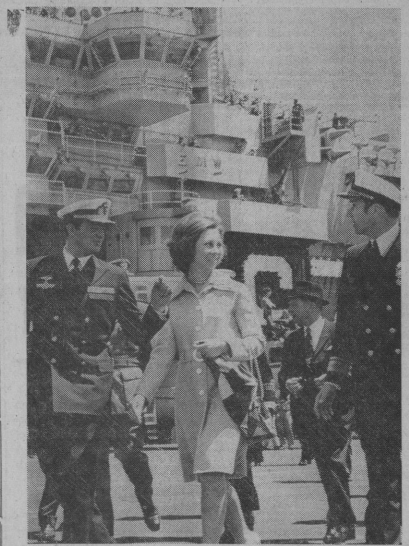
Rota (Cádiz).—Los Príncipes de España, don Juan Carlos y doña Sofía, acompañados por el embajador de los Estados Unidos en Madrid, durante su recorrido por el portaaviones «John F. Kennedy», anclado en aguas de la Base de Rota.