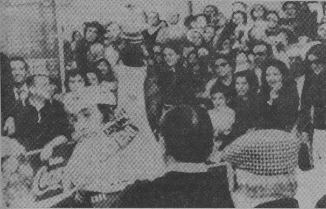
Calpe (Alicante).—El corredor belga Eddy Merckx se coloca el «maillot» amarillo, siendo así el primer líder de esta Vuelta Ciclista a España, que ha comenzado con una etapa contra reloj.