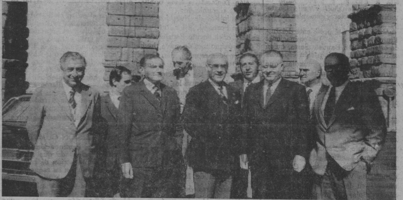
Ante el Acueducto, el ministro húngaro de Agricultura, que ayer —como informamos— visitó nuestra ciudad en viaje privado y de corta duración, posa para el fotógrafo junto a las autoridades segovianas y a las autoridades del Ministerio de Agricultura español que le acompañaron en este viaje.