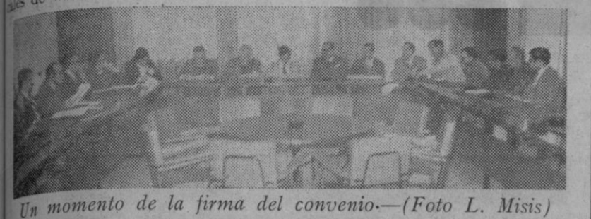
Un momento de la firma del convenio.

Incremento de salarios, dietas y vacaciones, con un acuerdo especial sobre retribuciones en caso de accidente laboral