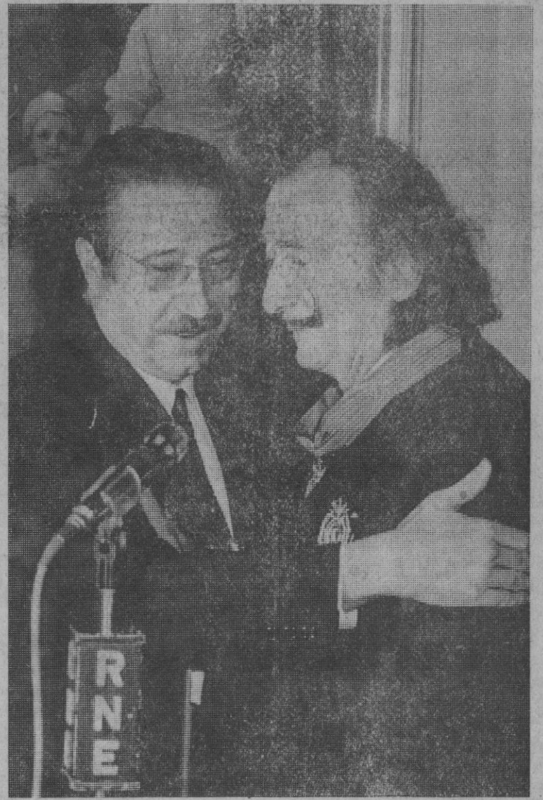
Madrid.—El ministro de Educación y Ciencia, don José Luis Villar Palasí, impone la medalla de oro de Bellas Artes al pintor Salvador Dalí.

CONDUCTOR: Mantener la derecha es velar por su propia seguridad y la de los otros.