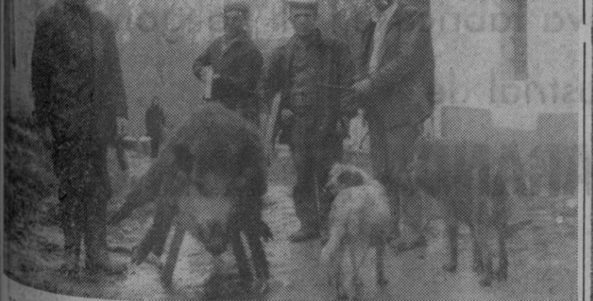
Un grupo de cazadores de Pradeda ha dado muerte a un jabalí macho de 120 kilos, en el monte bajo de los alrededores del pueblo. El caso ha llamado la atención tanto por el tamaño de la fiera como por no ser frecuente el que esta especie aparezca tan temprano cerca de los núcleos urbanos ya que, precisamente el tiempo más común para hallarles tan próximos es durante lo más crudo del invierno y no ahora.