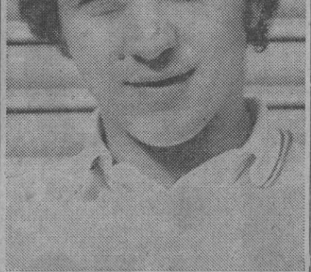
Paquito Fernández Ochoa es un joven deportista muy vinculado a nuestra provincia, ya que desde niño ha compartido alegrías y alguna que otra pequeña contrariedad con los esquiadores segovianos.

Por eso, ahora Segovia se dispone a ofrecerle un homenaje de amistad y adhesión, cuando está a punto de iniciarse una nueva temporada de competiciones. Ha sido difícil poder concretar la fecha, ya que Fernández Ochoa es un hombre que se ve inmerso en múltiples actividades, tanto deportivas como otras más de estricto carácter personal. Ha habido que aprovechar su estancia en Navacerrada, donde el equipo olímpico español está siendo sometido a una intensa preparación física, para poder concretar con él el día en que tendrá lugar este homenaje. Al fin se ha determinado que sea el próximo domingo, día 12, fecha en que juntamente con las pruebas de admiración y simpatía que los segovianos en general van a rendirle, la Deportiva Alpina Segoviana le entregará su título de socio de honor, en el transcurso de una cena que se celebrará en el Mesón de Cándido a las nueve y media de la noche. Según parece, previamente a este acto habrá una proyección de películas sobre la vida deportiva del campeón, en la Caja de Ahorros, con entrada pública.