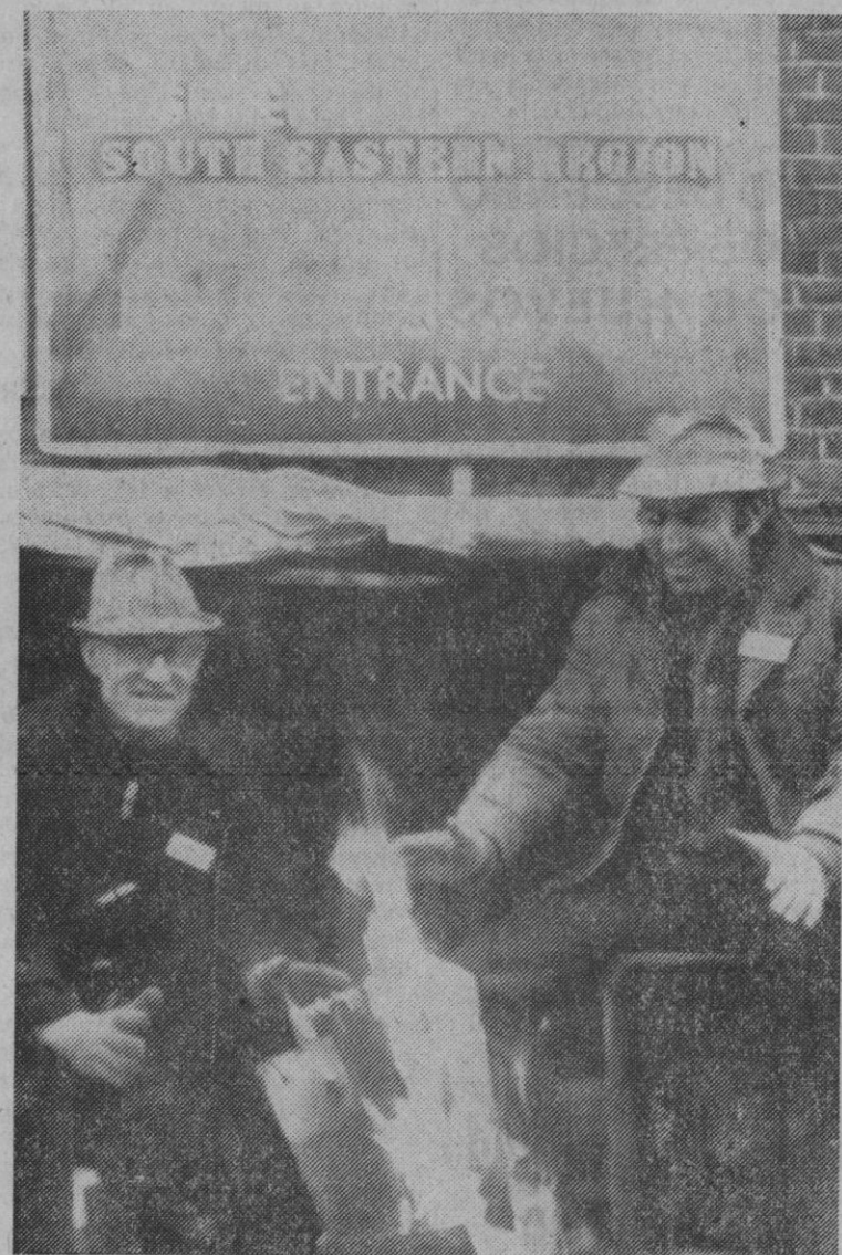
Londres.—Dos mineros, en funciones de piquete a la entrada de una gran central eléctrica, se calientan con astillas, mientras que en la central los informes indican que las reservas de combustible descienden de un modo alarmante conforme la huelga de mineros entra en su sexta semana.