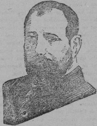
El nuevo Ministro de Instrucción Pública, don Elias Tormo, que hasta ahora ha ocupado el cargo de Rector de la Universidad Central.

de decirse que, al escribir estas líneas, todos los mallorquines, quien en el recinto de la iglesia a los pies de Jesús Sacramentado, quien desde el sitio de sus ordinarias ocupaciones, todos estamos unidos en espíritu los venerables padres de la Congregación, pidiendo al Señor les ilumine para acordar lo que nos convenga a la mayor gloria de El y de su fidelísima servidora. En la iglesia de Santa María Magdalena las solícitas hermanas de Sor Catalina han querido, como era justo revestir de especial solemnidad los actos de rogativa. Esta mañana, a las siete, ha habido Misa de Comunión general, con abundancia de fieles que se han acercado a recibir el Pan de los Angeles. Luego, previa exposición de S. D. M. ha empezado un turno de misas que durará hasta las doce. Y esta noche, a las seis y media, se dará conclusión a la rogativa. Todas las misas se han visto muy concurridas y es de esperar que, durante todo el día se hará amorosa peregrinación de toda la ciudad al sepulcro de la Beateta. ¡Ojalá puedan pronto alegrarse las columnas de este diario con la deseada noticia!