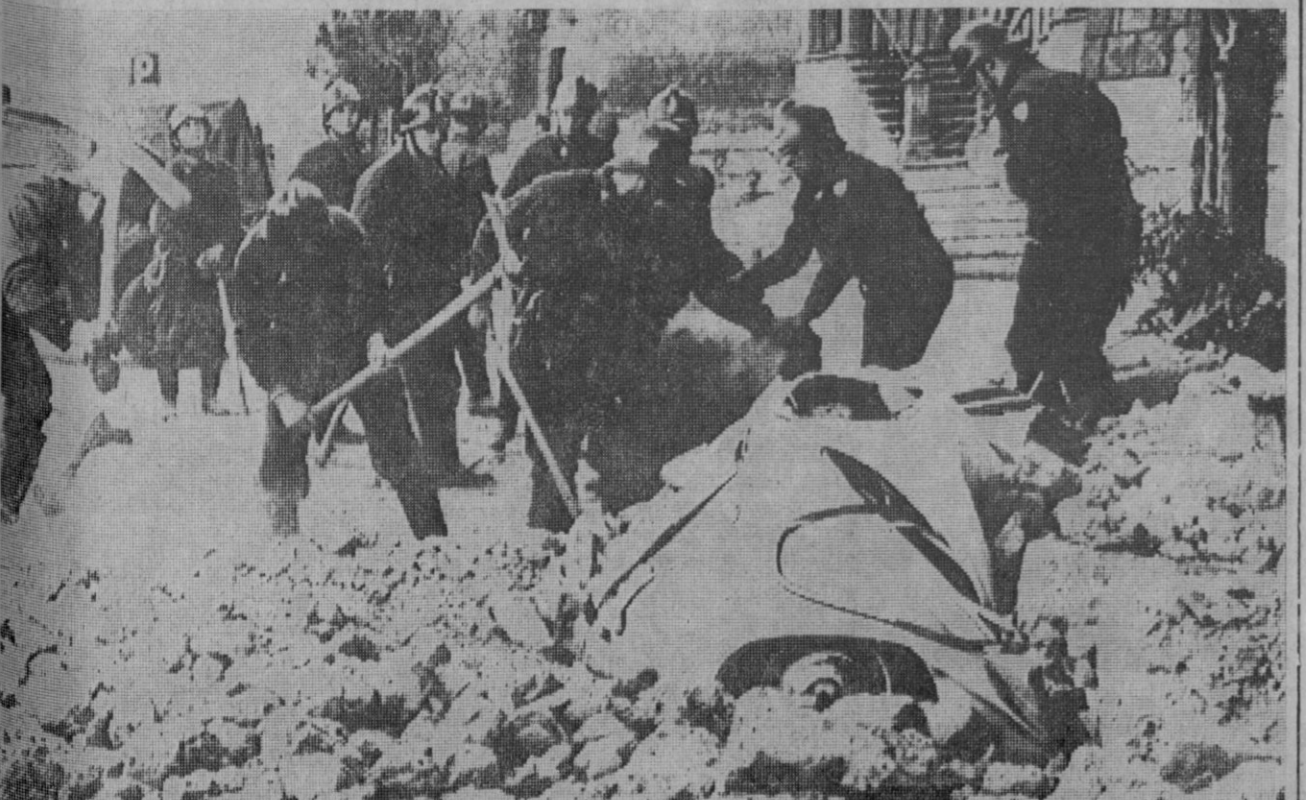
Toscana (Italia).—Los bomberos trabajan entre los escombros, en busca de posibles víctimas del terremoto que azotó la región y que ha producido hasta el momento 16 víctimas. En primer plano puede verse un coche aplastado por los cascos.

Cabe suponer fundadamente que esta prohibición está motivada por la aparición en cierto número de establos de la provincia, sitios en municipios diversos, de la epizootia denominada «fiebre aftosa» o «glosepeda».