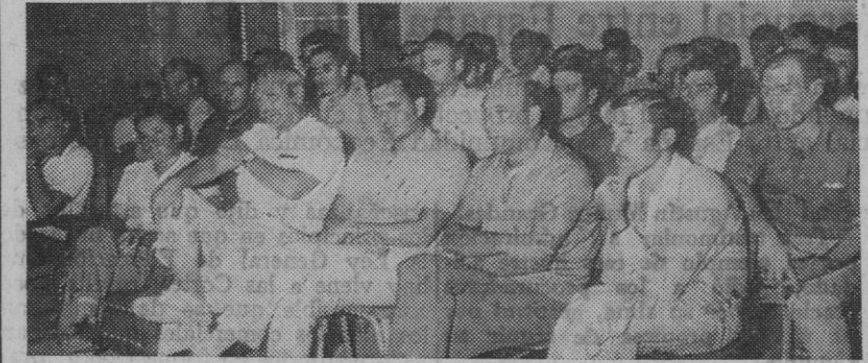
Un grupo de los jornalistas.

El temario general que se desarrolló durante estas jornadas comprendió temas referidos a empleo y formación profesional; desarrollo sindical; política del suelo y vivienda; desarrollo sindical, como en el caso del referido al desarrollo sindical, por cuanto que hoy es un tema—de cara a la nueva ley Sindical—que apasiona a todos los sectores del país.