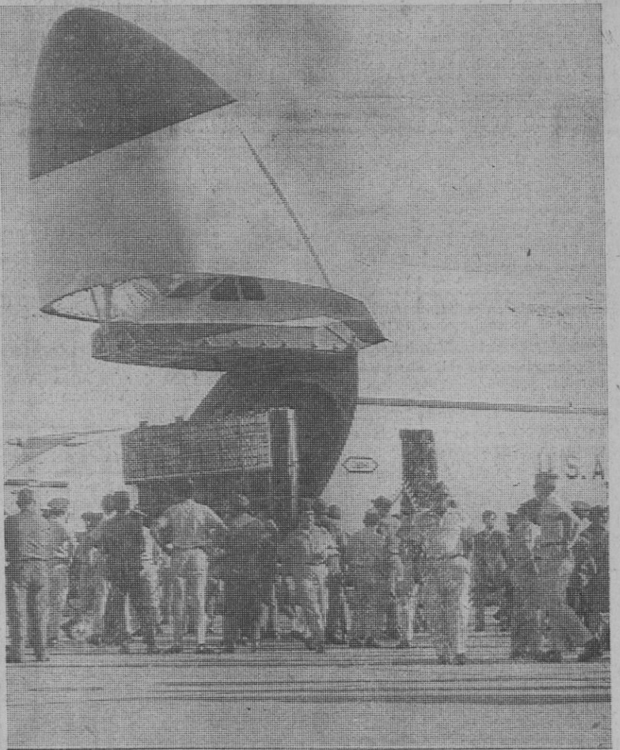
Madrid.—El mayor avión que vuela hoy en el mundo, el avión de transporte de las Fuerzas Aéreas norteamericanas «Galaxia», en el aeropuerto de Torrejón de Ardoz. Su longitud es de 75 metros y tan alto como un edificio de seis pisos.

El índice general cierra a 92,30 por 100, con una subida de 0,82 centésimas. Mejoraron las contrapartidas al cierre, predominando la demanda.—Cifra.