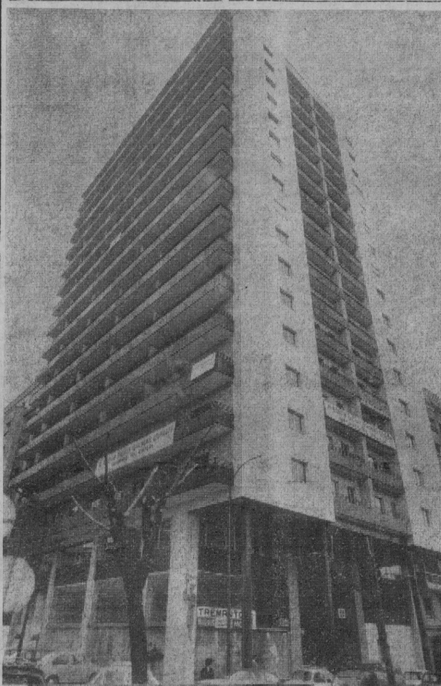
Madrid.—Edificio de la Avenida del Generalísimo número 88, donde se ha trasladado la agencia Europa Press y donde, desde el próximo día 24, en la tercera planta (la primera con terraza en la foto) reanudarán sus tareas la Dirección, Redacción y demás dependencias de la Agencia.

decreto-ley dado en Madrid a 22 de marzo de mil novecientos sesenta y nueve.—Francisco Franco.—El vicepresidente del Gobierno, Luis Carrero Blanco.—Cifra.