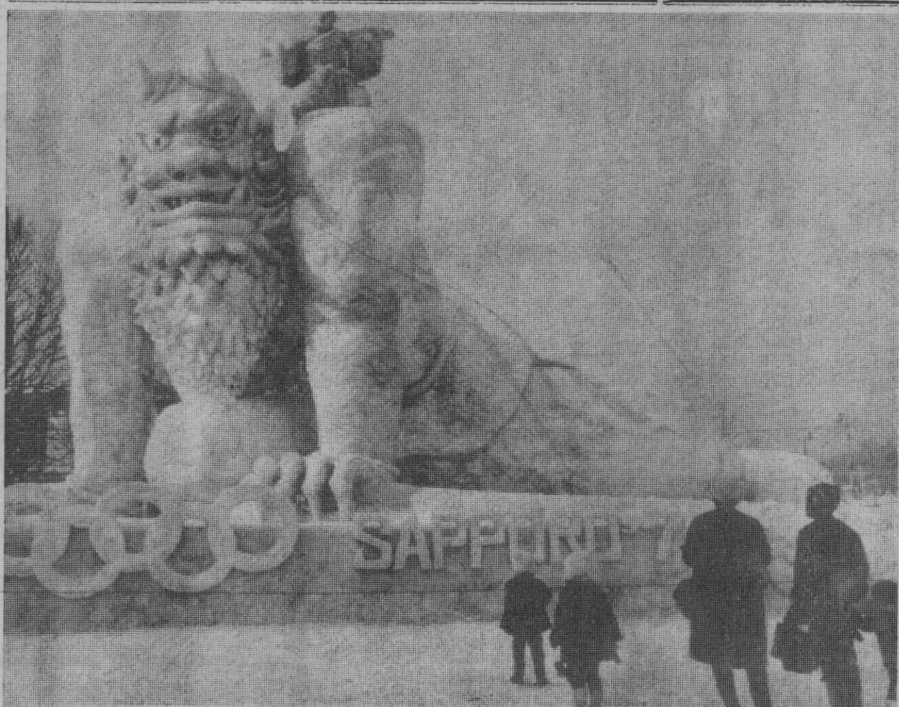
Saepporo (Japón).—Los pequeños contemplan algo asombrados y algo asustados el gigantesco diablo de hielo, obra maestra de la escultura japonesa sobre hielo, de la exposición de Sapporo. Más de cuatro millones de visitantes acuden todos los años a esta magna exhibición de la difícil técnica del moldeado sobre hielo.

La moneda hallada por Noel Tringham puede valer alrededor de cinco mil libras. «De ahora en adelante, es posible que beba, más a menudo, jarras de cerveza», ha declarado el afortunado bebedor. —Efe-Upi.