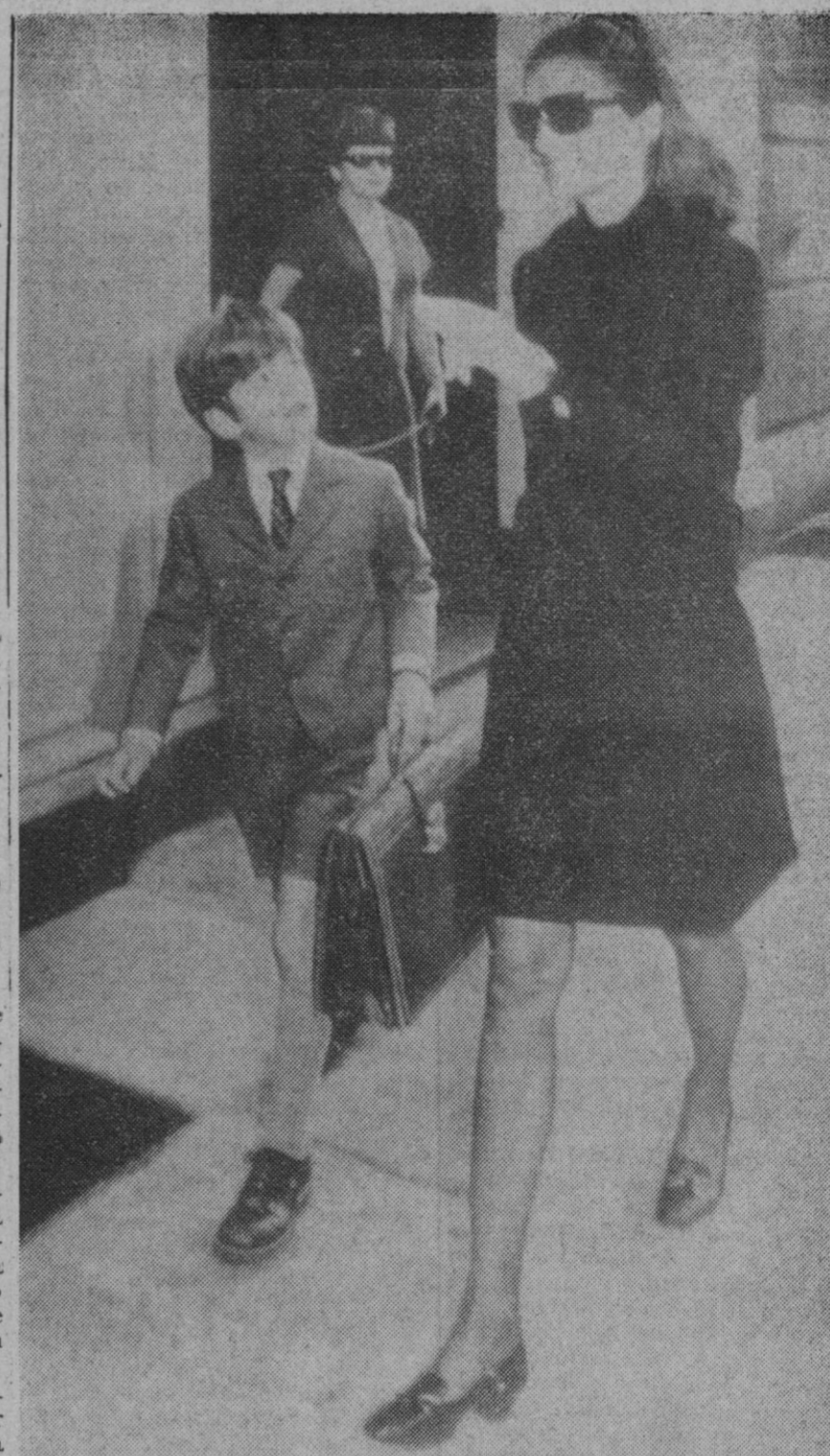
Nueva York.—Como una madre y un niño más, Jacqueline Kennedy acompaña a su hijo de siete años John F. Kennedy a la Collegiate School de Nueva York. El pequeño Kennedy ha sido matriculado en el tercer grado de la escuela privada de Manhattan.