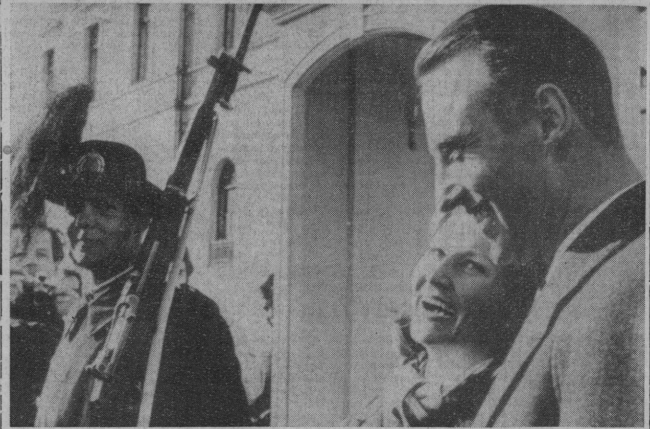
Oslo.—El príncipe heredero Harald de Noruega y Sonja Haraldsen aparecen ante el Palacio Real poco después de anunciar su compromiso.

«Dirigimos nuestro pensamiento—dice el Papa—a estos mártires del trabajo y por lo tanto de la civilización, con un sentimiento de profundo respeto y cordial solidaridad, augurándoles que puedan ser recuperados para alguna forma de actividades que les permita ocupar dignamente un puesto en la sociedad y proveer en suficiente medida a sus propias necesidades».