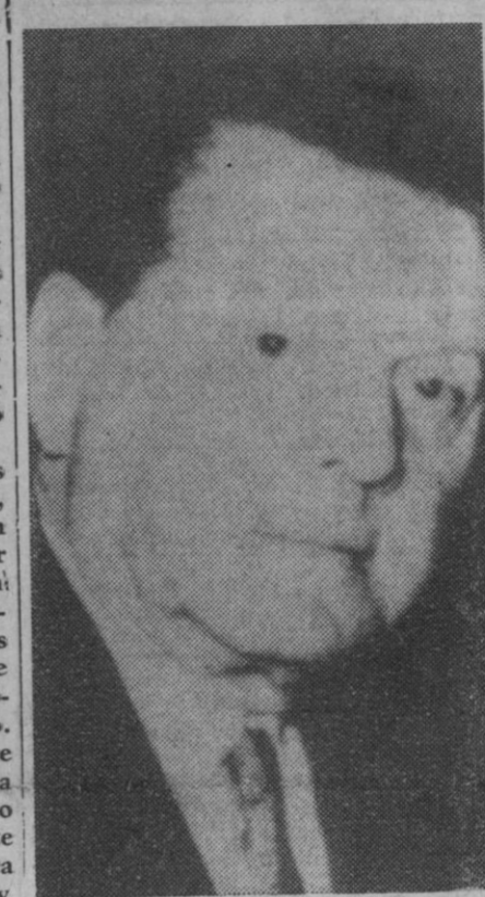
Frank E. McKinney, de 63 años, banquero y expresidente del Comité Nacional Demócrata, que ha sido nombrado embajador de Estados Unidos en España.