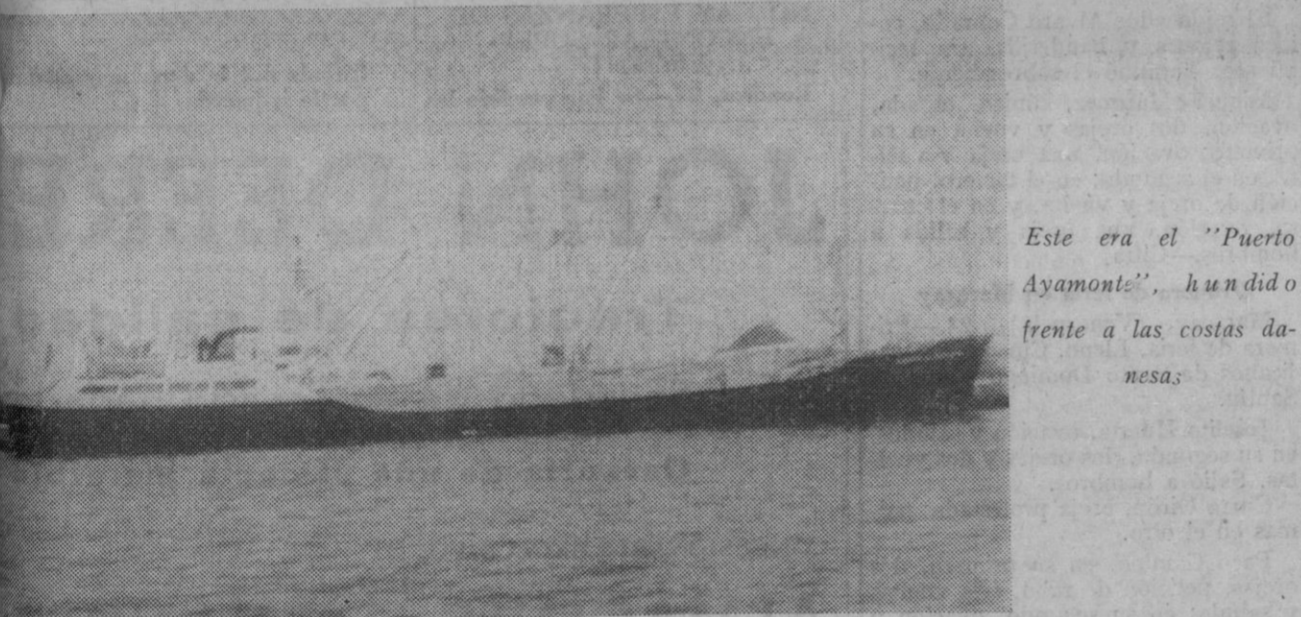
Este era el «Puerto Ayamonte», hundido frente a las costas danesas

Los momentos peores del salvamento fue el viaje desde nuestro barco al ruso, pues la mar podía con el bote. Ibamos materialmente debajo del agua, a muy baja temperatura. Pero la destreza del timonel ruso, que era el primer oficial, salvó todas las dificultades, gracias a