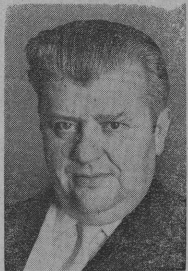
Per Haekkerups, ministro danés de Negocios Extranjeros

Barcelona, 27.—Comunica el Servicio Meteorológico que el temporal de aguas de ayer alcanzó a toda la región catalana, con cantidades que por el interior oscilaron entre los siete y 68 litros de agua por metro cuadrado, y en la zona que define la cordillera prelitoral se le asoció el temporal de agua y viento de Levante, dando cantidades que en Esparraguera alcanzaron 212 litros de agua por metro cuadrado; en Tiana, 140; en Cardedeu, 106; en el Montseny y Begas, 96; en San Adrián, 91, y en Barcelona, 89 litros de agua por metro cuadrado, por no citar otros puntos de menor importancia. Al amanecer de hoy el cielo presentaba variado aspecto, con zonas completamente cubiertas en el Valle de Arán, comarcas del Pallars, Urgellés, Pirineo oriental, comarca gerundense y ribera del Ebro, y bastante ruboso en el resto. Los vientos, que en general han disminuido en intensidad, soplan moderados del primer cuadrante en el Ampurdán y cumbres del Montseny. Las temperaturas máximas de la región fueron de 25 grados en Flix y la mínima de dos grados bajo cero en el Lago Negro.—Cifra.