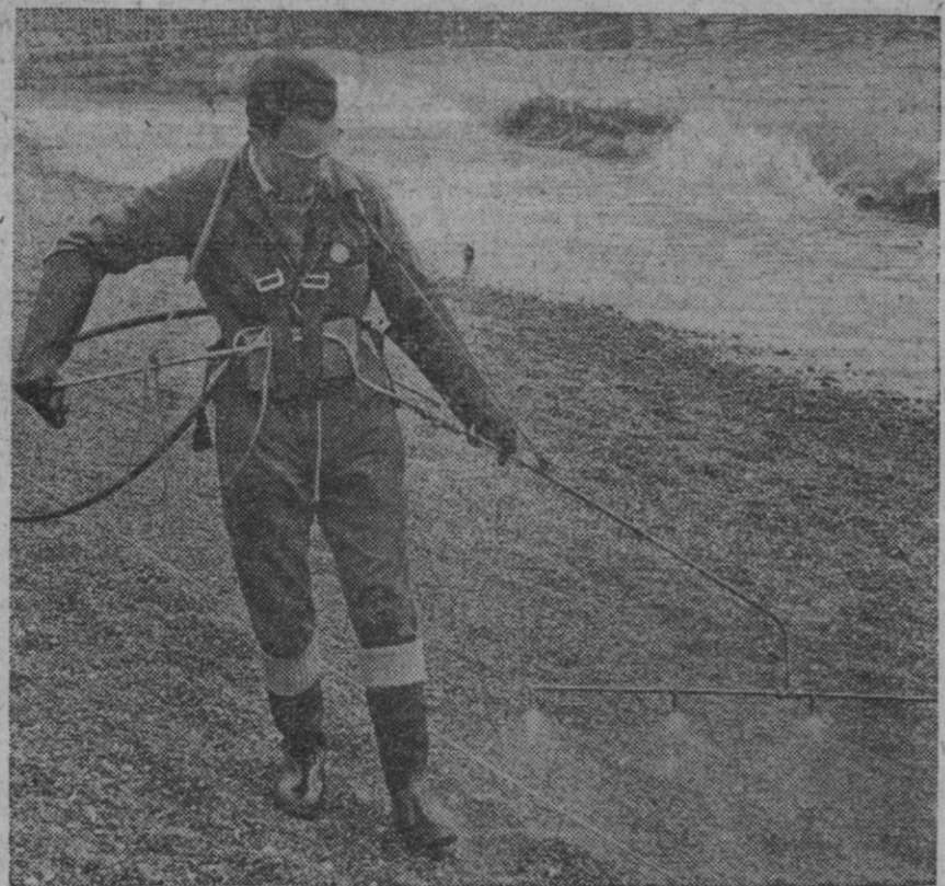
Durante una demostración de métodos para limpieza de playas, en Brighton, un técnico rocía un sector especialmente preparado de la playa con nafta de alquitrán de carbón. El mencionado sector de la playa fue primeramente cubierto con petróleo, luego rociado con nafta de alquitrán de carbón, y finalmente, al cabo de media hora del rociamiento, lavado con mangueras y agua. Al concluir la operación, se había, efectivamente, eliminado el petróleo de la playa.

La Haya, 16.—«Paracaidistas indonesios han logrado establecer una pequeña cabeza de puente en la península de Onin, al norte de la bahía de Fak Fak, en la Nueva Gui-