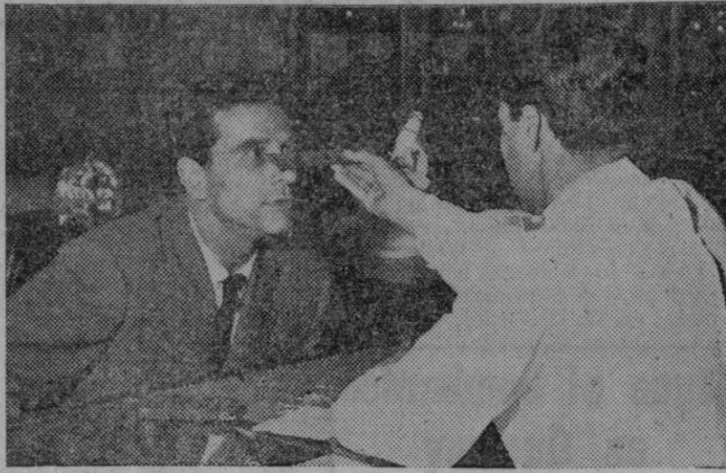
Ajustar la montura a las facciones, es importantísimo. El óptico cuida con capacidad estos detalles, de los que depende la eficacia de los lentes