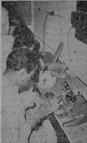
ESCUELA NACIONAL DE OPTICA. Taller de Control - Sección de fotofotómetros. Aquí el óptico se especializa y capacita en todos los problemas de la óptica física.