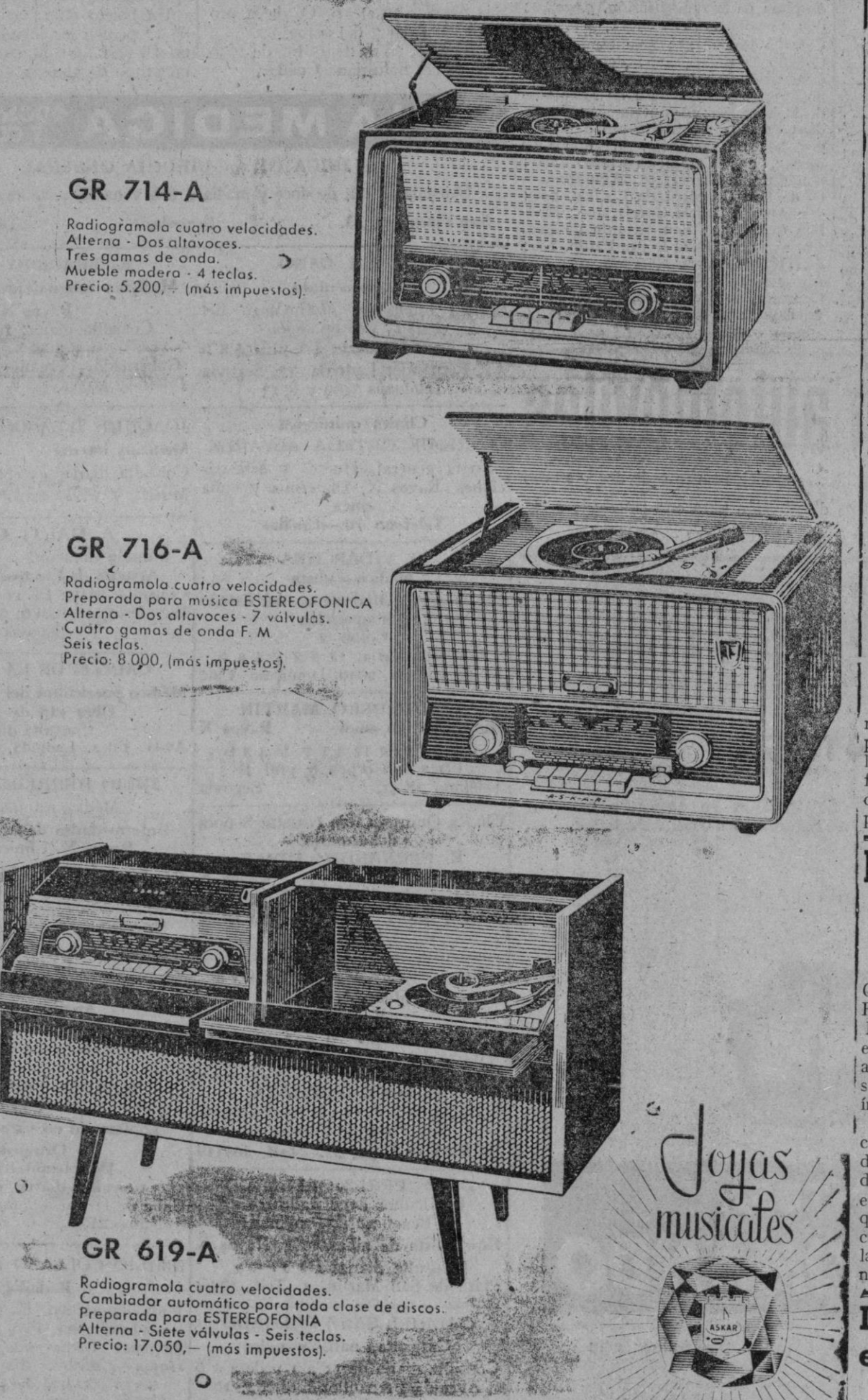
GR 714-A Radiogramola cuatro velocidades. Alterna - Dos altavoces. Tres gamas de onda. Mueble madera - 4 teclas. Precio: 5.200,- (más impuestos).