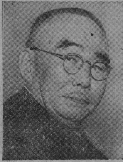
Tanzan Ishibashi, el nuevo primer ministro del Japón

El fuel-oil se suministrará a las industrias al precio de 1.553 pesetas la tonelada, a granel, incluido el impuesto, y los usuarios que utilicen este combustible para industrias térmicas de gas o de cemento, serán bonificados en 535 pesetas por tonelada, mientras lo estime indispensable el ministerio de Industria y siempre dentro del plazo máximo de dos años, con disminución del precio normal de venta al público, con arreglo a los cupos que les hubiera sido señalados por la Dirección General de Industria.—Cifra.