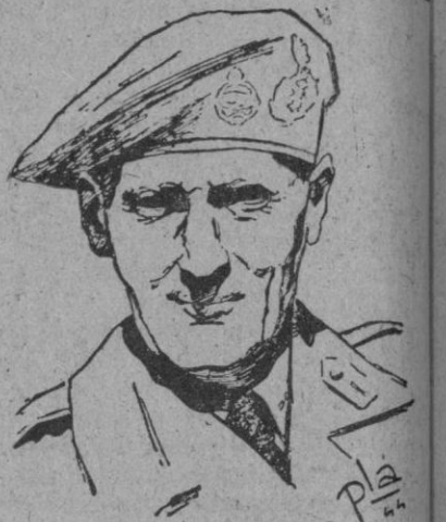
El mariscal Montgomery

La Unión Occidental debe ser más internacional