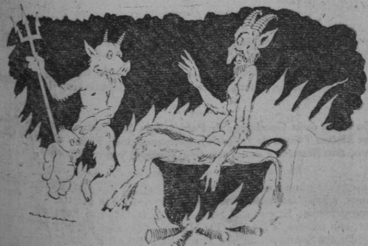
—¿Qué infierno le damos a éste? —Mandadle al "paraíso soviético", que con ello ya va arreglado.

Es la hoja del Fomento de Vocaciones Sacerdotales. Suscribiéndose usted a ella (diez céntimos mensuales) ayuda al Seminario. Envíe usted este menefilete con sus señas al señor rector del Seminario, franqueado con dos céntimos.