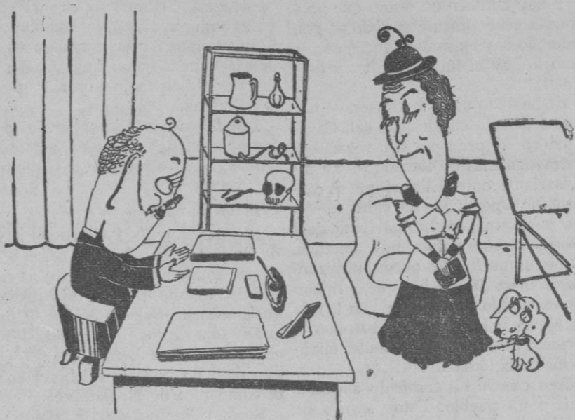
—Tengo que auscultarla. —Entonces prefiero volver con mamá.

se hizo un intento para consolidar el terreno ganado. Ante esta actitud, Stalin tiene dos alternativas para elegir. Puede relajar las regulaciones sobre la importación y comprar productos extranjeros que, cedidos a los campesinos, pueden estimularles a incrementar la producción agrícola. Puede redoblar sus esfuerzos para obligar a las colectividades recalcitrantes que alimenten a las ciudades «por amor al Plan». Lo más probable es que siga la ruta media. Para 1933 el Plan prevé un incremento de la producción de sólo el 13-14 por 100, en vez del 22 por 100. El campo no estará sujeto a la misma presión, con vista a la exportación, y al mismo tiempo, las factorías soviéticas producirán más mercancías. Si puede evitarse la inflación, el tráfico entre la ciudad y el campo pronto se verá más normalizado. Mientras tanto, las requisas arbitrarias han sido substituidas por una tasa fija, con la innovación importante de que el exceso de producción sobre la tasa puede venderse libremente. Políticamente se ha iniciado una nueva propaganda, de la que se espera resultados ventajosos al disminuir las restricciones aduaneras. Si la Naturaleza se muestra propicia este año y la cosecha es abundante, el inmediato problema de la alimentación puede ser resuelto temporalmente, pero la lucha para conquistar la voluntad de los campesinos todavía será larga y difícil. (De la Agencia Internacional Arco.)