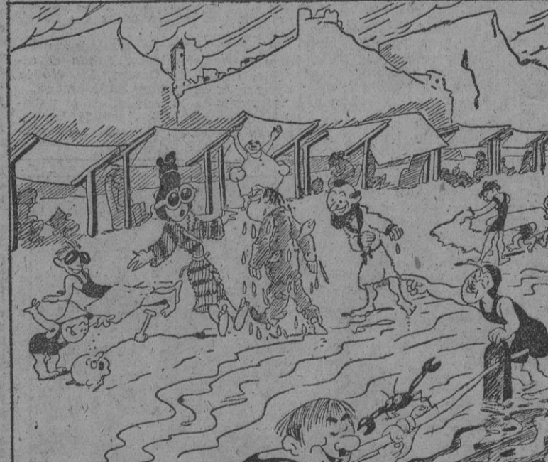
LOS DISTRAIDOS, por Bellón

WASHINGTON, 22.—La Oficina de Informaciones de Guerra anuncia que hasta la fecha las fuerzas armadas de los Estados Unidos han tenido las siguientes pérdidas: 44.143 hombres entre muertos, heridos y desaparecidos. Esta cifra de pérdidas registradas desde el comienzo de la guerra—añade el comunicado—se descompone de la manera siguiente: 4.801 muertos, 3.218 heridos y 36.124 desaparecidos. En este total están comprendidas las bajas de la Marina de guerra, el Ejército, la Marina del servicio de costa y las fuerzas de Filipinas. Además, 1.022 oficiales y marinos han sido hechos prisioneros. (Efe.)