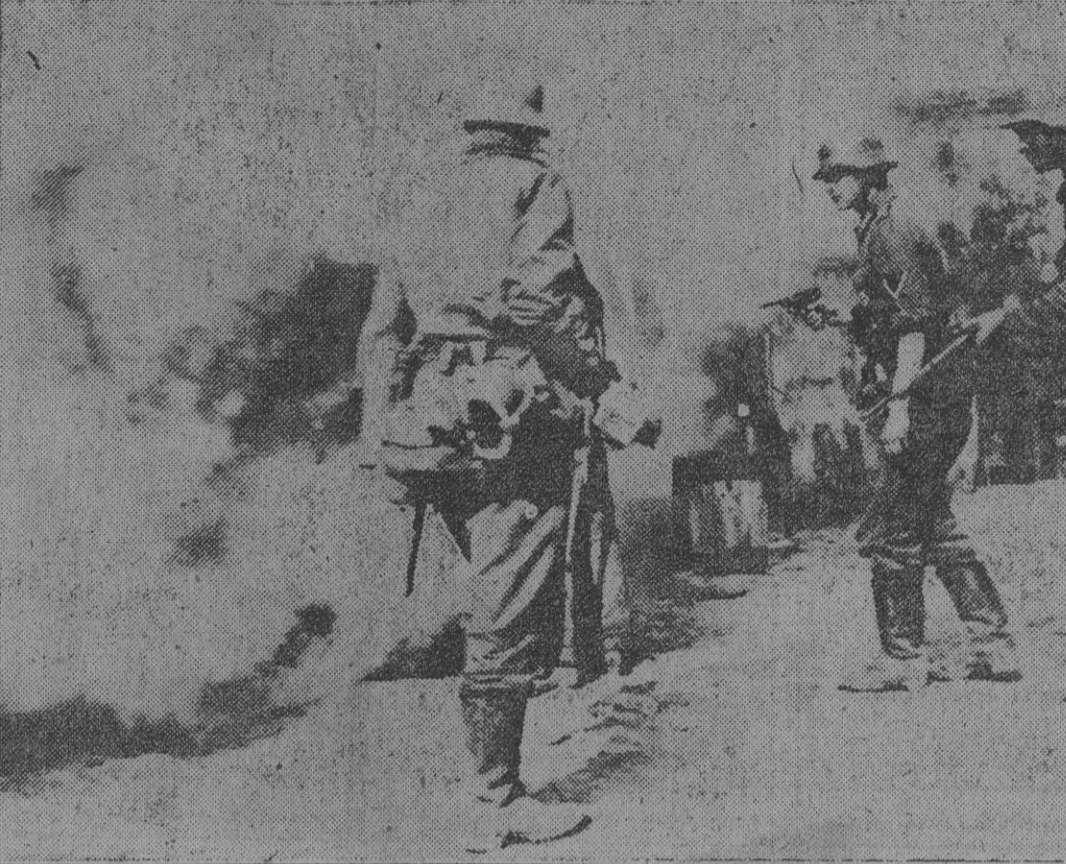
A veces, restos de tropas rusas en algunos reductos que quedaron a vanguardia hostilizar las columnas de avance. Las tropas dedicadas a la limpieza de los sectores conquistados apelan a las bombas de mano para desalojar a los restos del enemigo.