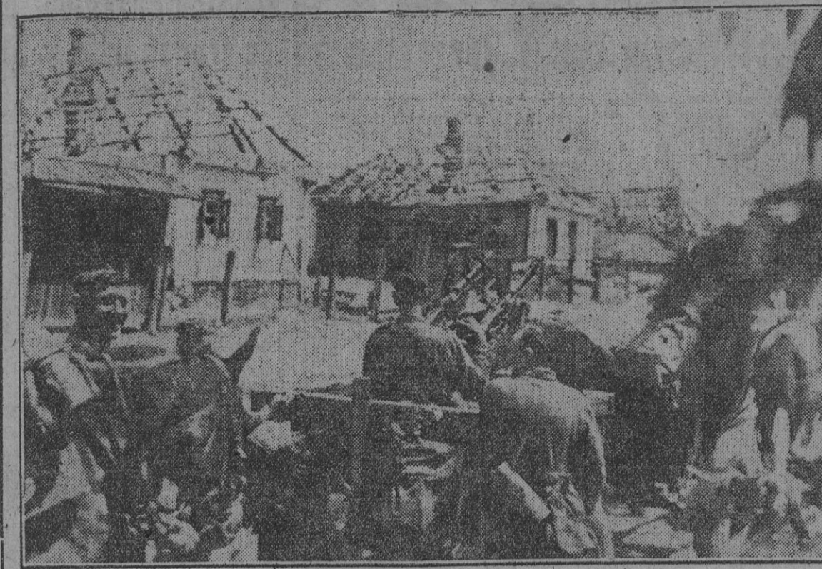
El avance alemán es vertiginoso en algunos sectores del frente. Esta aldea rusa, hoy en la retaguardia, por cuya calle central atraviesa un convoy de aprovisionamiento, era hace pocos días teatro de encarnizado combate.