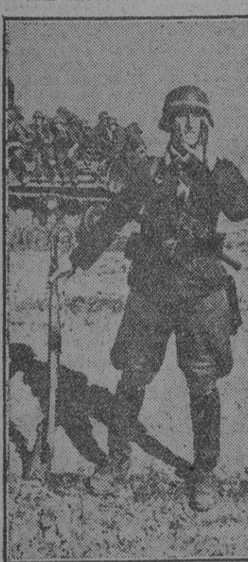
La primera ofensiva de las tropas mecanizadas soviéticas ha sido rechazada al norte de Orel. Tras breve pausa en el combate, el orden de ataque ha llegado. He aquí a un soldado de Infantería de las tropas de aquel sector comunicando el orden del Alto Mando alemán.

WASHINGTON, 22.—"Las pérdidas de barcos durante la semana terminada el 12 de julio han sido las más elevadas que se han registrado desde el comienzo de la guerra—anuncia la Dirección de Navegación de Guerra—. El número de barcos hundidos ha sido muy superior al de los construidos."