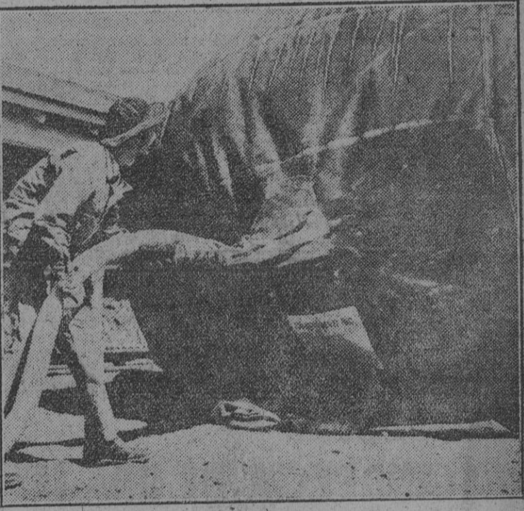
La D. C. A. norteamericana emplea estos enormes aerostatos, depósito de gas, para impedir el vuelo bajo del enemigo. En la foto se aprecia la preparación de uno de estos globos.

La situación, sin embargo, no podemos decir que no sea halagüeña, pues hemos salvado los tres años más difíciles de nuestra vida económica, y en los últimos meses se acusa con rasgos importantes la mejora de la situación, y los precios han emprendido ya su curva de descenso. (FRANCO)