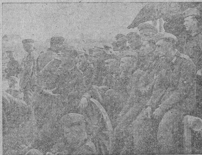
Un día de descanso es aprovechado por la banda de un regimiento alemán, para dar un concierto, que los soldados escuchan atentamente

Lo que antes, en la época de aquellos regímenes que procedieron a nuestro Movimiento, hubiera dado motivo a que los voceadores del reductorismo proletario armaran tracas con sus pistolas desde las Casas del Pueblo, organizaran huelgas y fomentaran odios hasta conseguir clima adecuado a sus aspiraciones, lo han hecho hoy unos hombres falangistas que trabajaron muchas horas —día y noche— en el Sindicato. Ellos han sido los portadores de los anhelos de todos los ferroviarios, y para ellos sólo han sido las preocupaciones y las inquietudes del proceso. Y lo que antes, una vez conseguidas las mejoras, hubiera dado ocasión a numerosas manifestaciones «proletarias», hoy, en nuestra España, con los modos nuevos del Estado nuevo y por la gravedad que informa los actos de nuestros gobernantes, se ha tramitado y resuelto con la mayor discreción y sencillez, pasando el problema desde el Sindicato al director de la Red, de éste al ministro de Obras Públicas y, finalmente, al Consejo de Ministros, hasta merecer la aprobación del Caudillo. Urgía remediar esta situación y se ha remediado. La Red Nacional de Ferrocarriles ha vencido las dificultades económicas con los medios heroicos. Contra el imposible económico ha surgido la solución valiente, y ha sido vencida la miseria de los ferroviarios porque así lo han querido el Jefe Nacional de la Falange y ésta por medio de su Central Nacional Sindicalista.