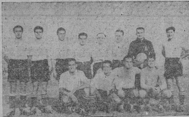
El victorioso equipo del «Constancia» F. C.

parece haber emprendido desde que, en las tierras peninsulares, lo defienden las blancas camisetas del club inquense.