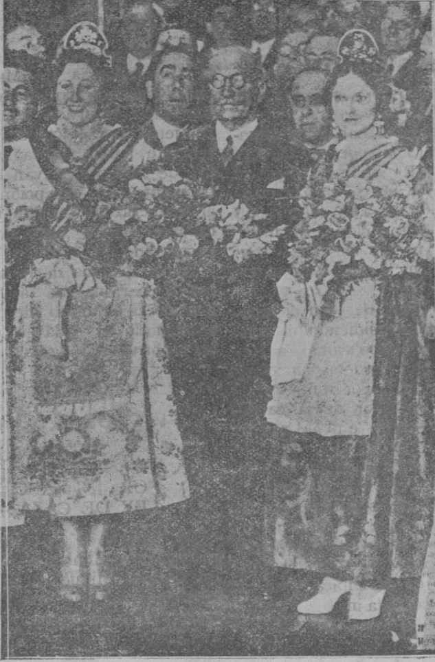
El Presidente del Círculo de Bellas Artes don Alejandro Lerroux con las distinguidas señoras valencianas, ataviadas con el traje típico, en el homenaje que el Círculo dedicó a Valencia