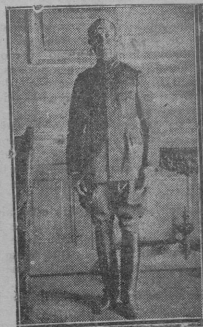
He aquí el jefe de la revolución chilena, cuyos procedimientos extremistas han originado una contrarrevolución que ha derribado el gobierno del coronel Grove