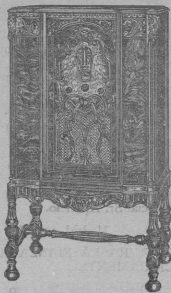
ONDA CORTA y LARGA