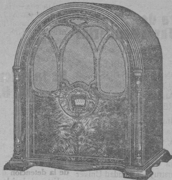
ONDA CORTA y LARGA

Un solo mando directamente a la corriente alterna Control de tono gran selectividad Demostraciones a solicitud