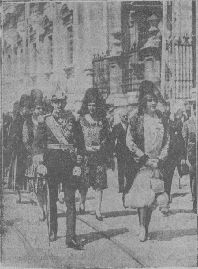
SS. MM. los Reyes y SS. AA. RR. las infantas al salir de la Catedral, después de visitar los Sagrarios