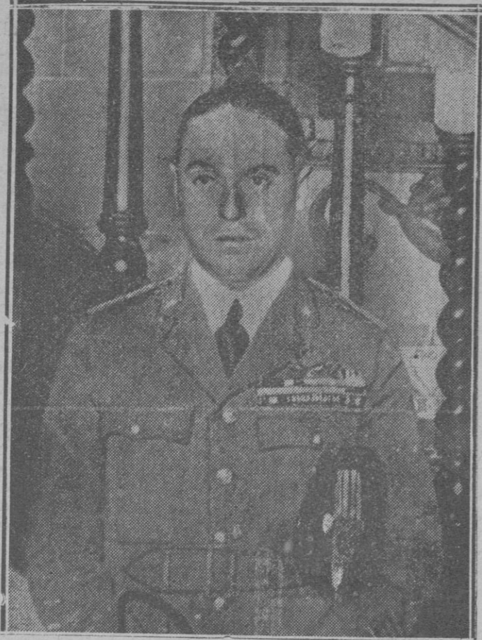
El aviador italiano Marqués de Pinedo, que acaba de visitar España, en su vuelo de retorno a Italia