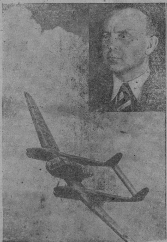
EL "FOCKE WULF 189" BIMOTOR DE RECONOCIMIENTO. — La aviación alemana ha lanzado un nuevo modelo de avión con dos fuselajes. Se trata de un bimotor Focke Wulf 189, al que se le califica de arma terrible. Lleva ametralladoras para defenderse y atacar y un pequeño cañón de tiro rápido. Equipado con dos motores Argus puede desarrollar velocidades fantásticas y ser avión de caza. Su constructor Ingeniero Kurt Tank (en el ángulo) es calificado como un gran técnico en aeronáutica.

Publicadose programa. Instancias hasta 1.º mayo. CONTESTACIONES AJUSTADAS AL ACTUAL PROGRAMA. Hallause venta en Academia "MIRO", Correo 4, MADRID