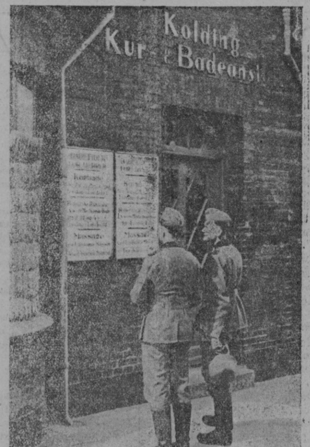
EL EJERCITO ALEMAN EN DINAMARCA.