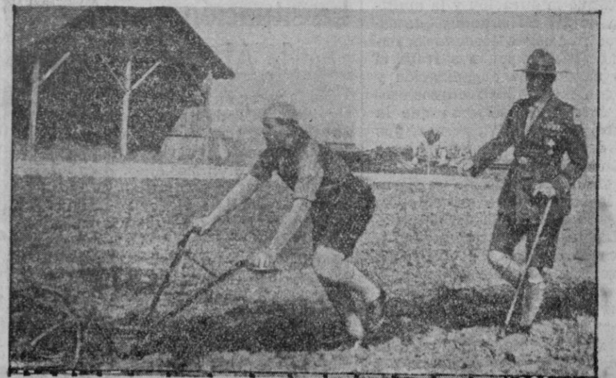
Un príncipe que aprende de todo. El Príncipe Miguel de Rumania está recibiendo instrucción especial para conocer todo lo de su país. Después de la instrucción militar, aparece aquí practicando agricultura ya que es su propósito conocer todo lo de la vida de su país. (Cliché Medit.)