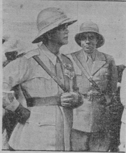
Los dos vencedores de la guerra Italo-Etiopé. La última fotografía del Mariscal Badoglio con el Ras Guxa. La prensa italiana considera a ambos como los triunfadores de la gran acción militar.

La rebaja de pasajes para la época de las próximas ferias y fiestas debería gestionarse y conseguirse con tiempo oportuno para poderlo divulgar a fin de que tuviera la debida eficacia.