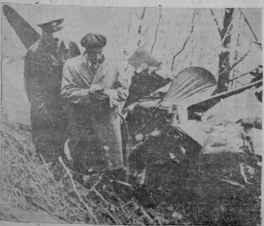
Un avión suizo se estrelló contra el suelo en Bogno, Tessin, quedando completamente destruido.

Es un hecho que el problema de las relaciones entre las clases socia-