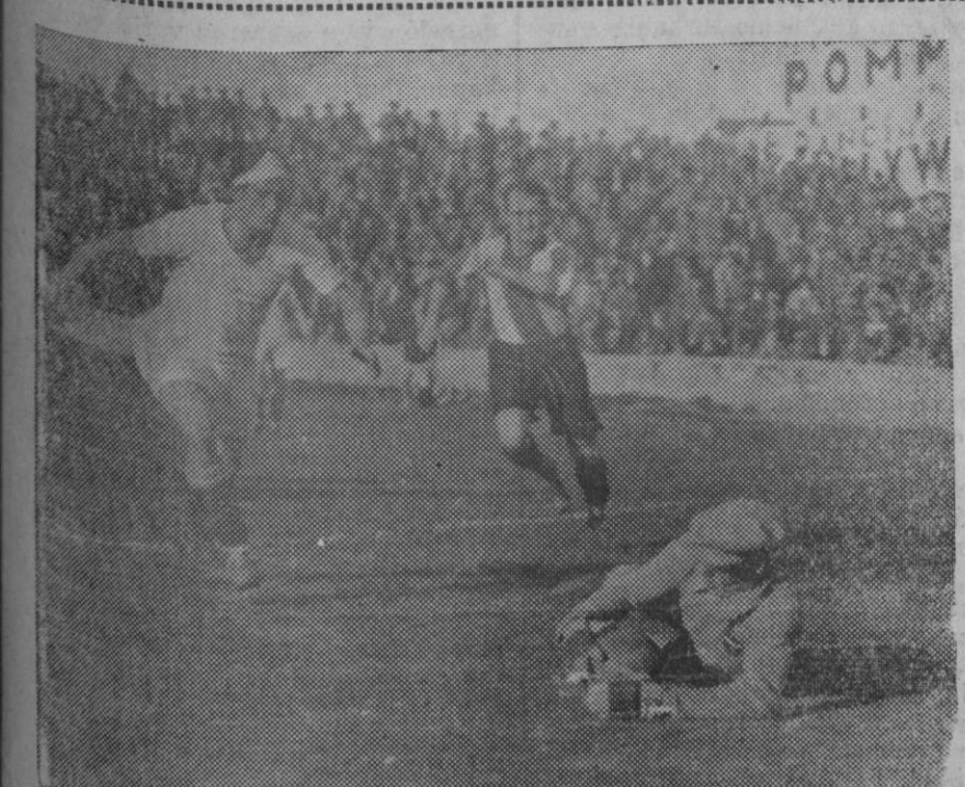
EL CAMPEONATO DE LIGA. ESPAÑOL — VALENCIA EN BARCELONA.— En un partido de escasa calidad y excesivamente violento, venció el Valencia con todo merecimiento por 2 goals a 1. Un momento difícil para la puerta del Valencia.

Hemos diseñado, a grandes rasgos, y sin excesiva minuciosidad, por no aburrir al lector, la importancia estratégica de Baleares para el caso de vernos envueltos en una guerra, o para el más deseable de que nos propongamos imponer nuestra voluntad de no intervenir en ella. Su situación para ambos propósitos es pintiparada, hasta tal punto, que si no existiera Menorca y hubiera que construir una isla artificial, al elegir su emplazamiento, se elegiría, precisamente, el que ahora tiene. Prodigia ha sido la Naturaleza con nosotros. Razón de más para que no regateemos el obligado complemento. Sería demasiado