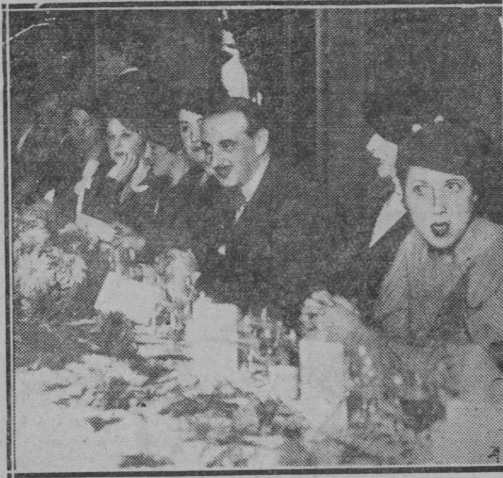
MADRID. — Con motivo del éxito obtenido por el Sr. Pemán con su obra dramática el «Divino Impaciente» numerosos amigos y admiradores le obsequiaron con un banquete

su cuenta y riesgo. Es seguro que muchos de los ex-constituyentes se refugiarán en sus casas, desolados y sin esperanza de resurrección. Otros volverán a sus antiguas propagandas demagógicas, que tanto éxito obtuvieron en otras horas. Nos dirán que van a hacer caso. En los dos años y piquito que han funcionado, han demostrado plenamente que un Parlamento es capaz de divorciarse de la opinión pública con una rapidez ejemplar. Cada cual a su casa y a su oficio, que el de hacer leyes no