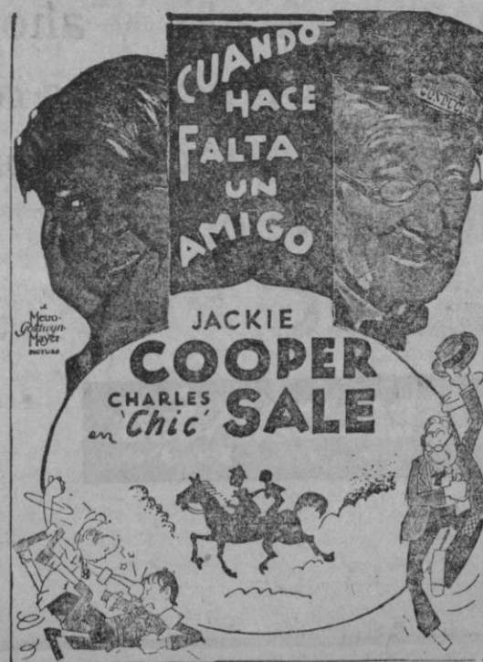
Un film Metro Goldwyn Mayer