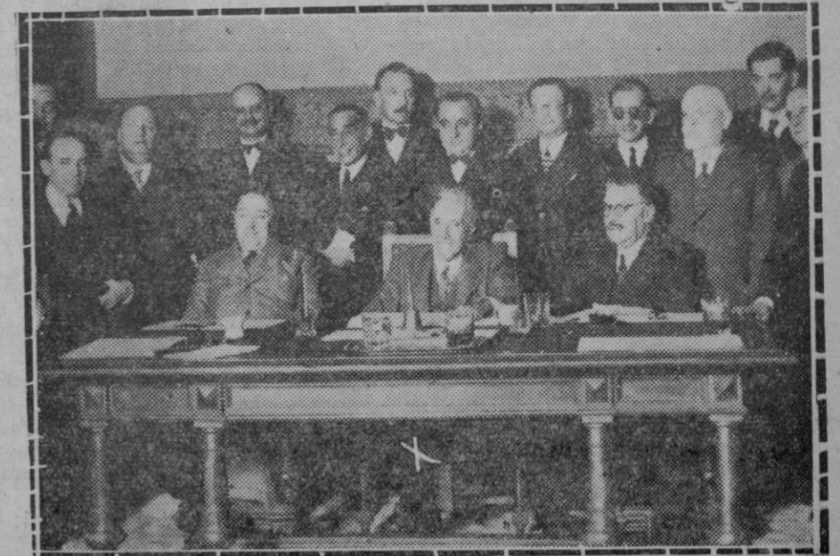
MADRID.—La primera reunión de La Diputación permanente de las Cortes.