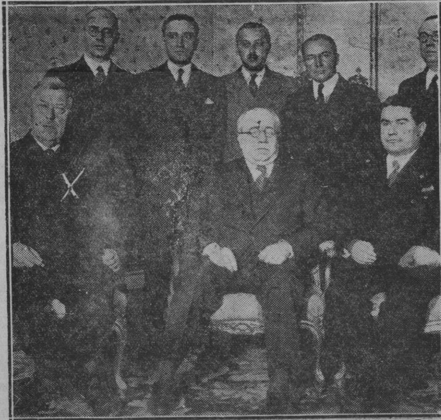
El doctor Eckener con el Presidente Sr. Azaña durante la visita con la comisión del Ayuntamiento de Sevilla para darle cuenta de la cuerda para la construcción del aeropuerto en Sevilla.