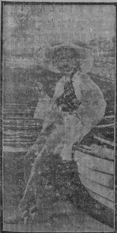
Los bellos rostros del cine.—Bette Davis.

La realidad nacional es tan densa, que hay que volar alto sobre ella. Cada hora tiene que reflejar el acorde de sus circunstancias. La realidad no puede resbalar á flor de la epidermis; por el contrario, tiene que adentrarse y llegar á lo más íntimo de la sensibilidad. Es el momento del bien hacer y no del infinito desear.