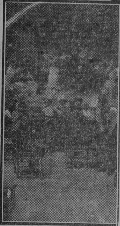
«Un café cantante.»

Cuéntanse entre sus discípulos más distinguidos y aventajados la