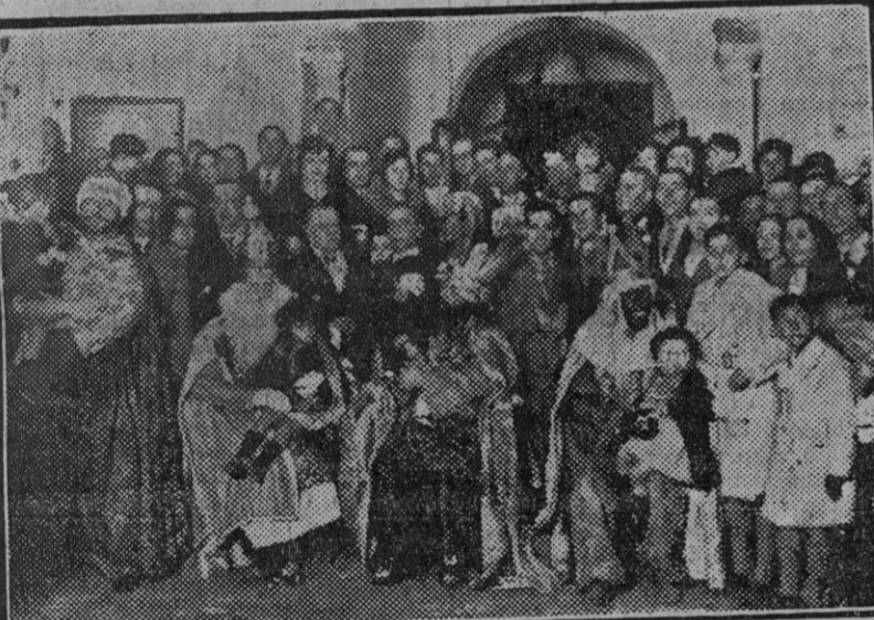
Los Reyes Magos, acompañados de las autoridades, durante su visita al Hospicio. (Foto. Sánchez del Pando).

Muchas mercaderías han quedado por completo inservibles.