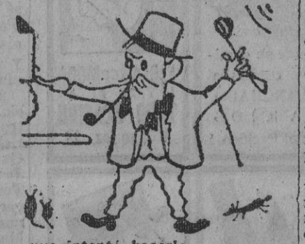
...que intentó hacerlo...