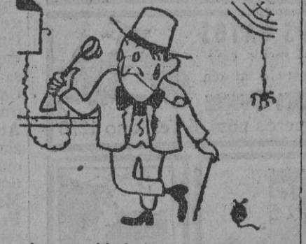
...la necesidad de telefonar...