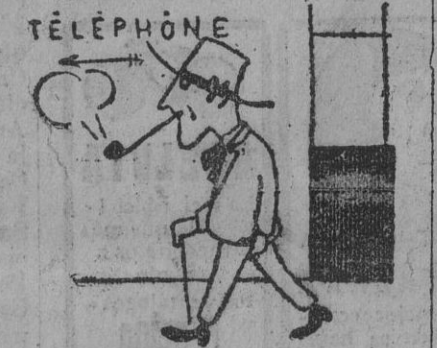
de un señor a quien apremiaba...