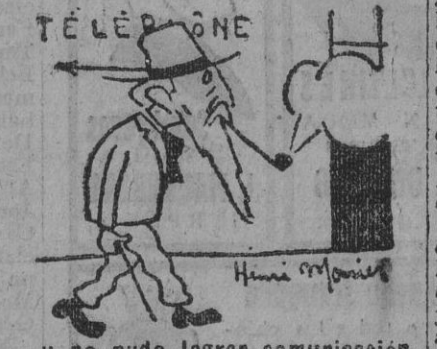
...y no pudo lograr comunicación.