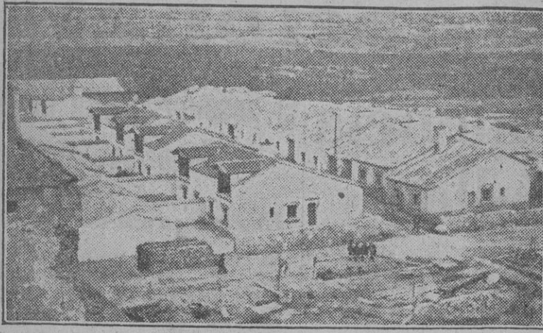
Aspecto del grupo de viviendas ya terminadas, construidas por Regiones Devastadas.