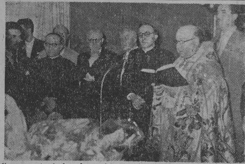
Un momento de la solemne inauguración y bendición del local del Circolo Catalán en la capital de España, acto al que asistieron destacadas personalidades de Madrid, junto con la representación catalana