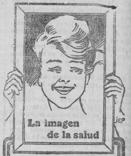
La imagen de la salud