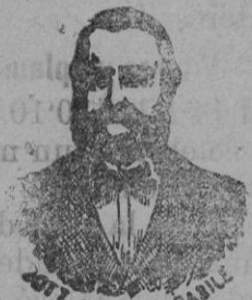
Inventor de los renombrados medicamentos CASILE