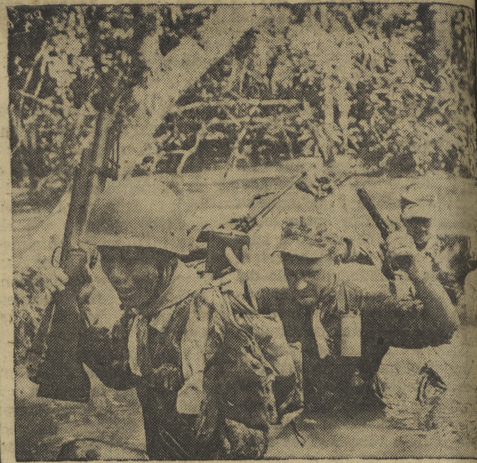
PATRULLAS VIETNAMITAS. — Asesores militares norteamericanos acompañan a una patrulla vietnamita para limpiar de guerrilleros del Viet Cong un pantano de la selva en el Vietnam del Sur

«Esta —ha concluido el Papa— es la imagen de la «Ciudad de Dios» la ciudad esclarecida por la fe y sostenida por la caridad, a donde todos son llamados y cada uno es esperado y acogido». Efe.