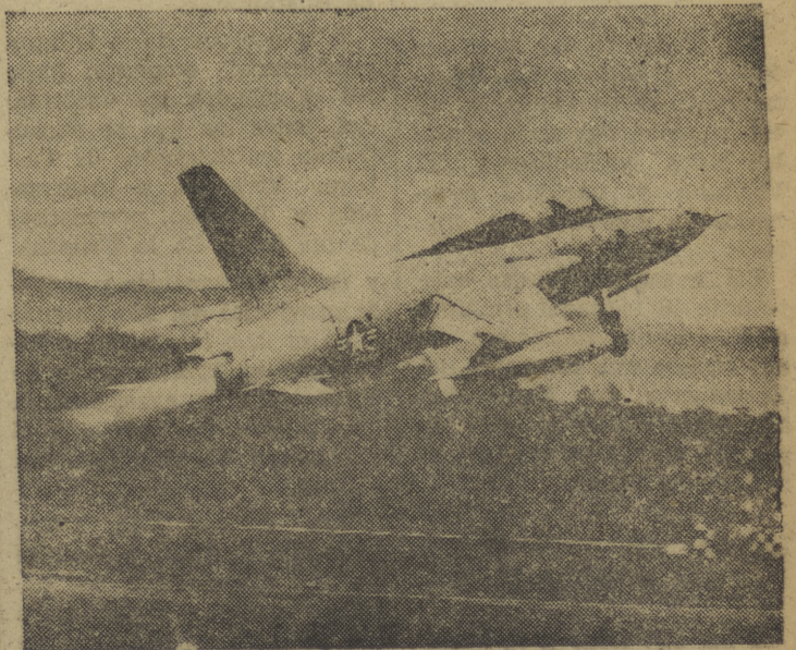
EL SUPERSONICO THUNDERCHIEF. — Un Thunderchief F-105F de las Fuerzas Aéreas de los Estados Unidos despega durante un vuelo de pruebas efectuado ante las autoridades de la defensa aliada, en Ramstein, Alemania Occidental. El aparato vuela a más de dos veces la velocidad del sonido