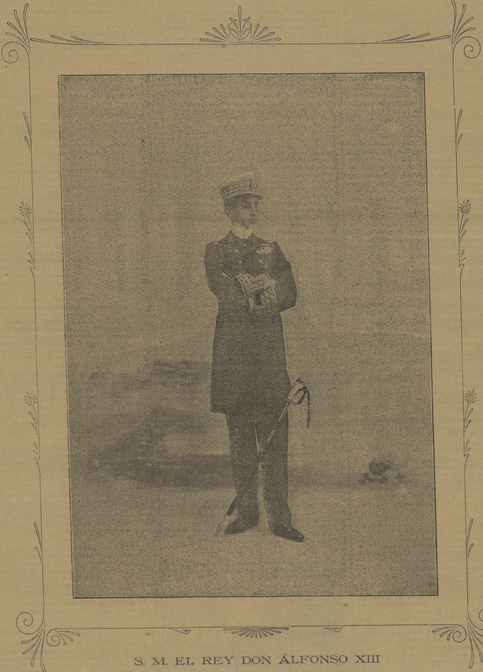
S. M. EL REY DON ALFONSO XIII

Al salir el Conde de la regia estancia, le rogó el Rey permaneciera allí algunos instantes más