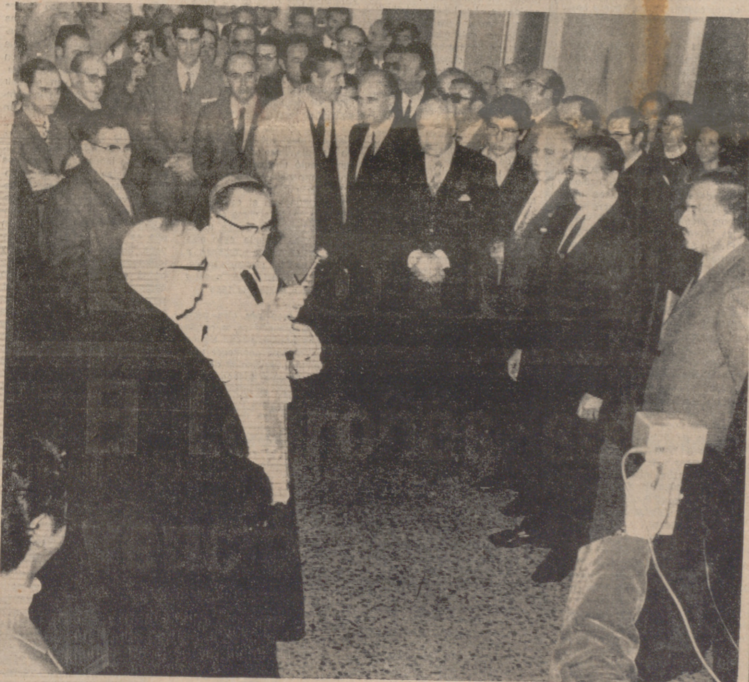
Ayer estuvo en nuestra ciudad el ministro de Educación y Ciencia. En las horas que permaneció entre nosotros presidió tres inauguraciones: la sede de la Delegación de su Departamento, el nuevo Instituto de reciente construcción y el Museo de Logroño. De su breve estancia damos amplia información gráfica y literaria en nuestra última página. Deseamos que este personal contacto del señor Villar Palasi con nuestra autoridades sea fructífero para la provincia.